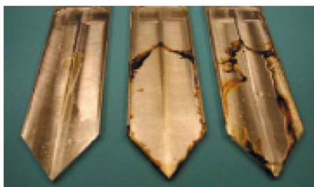
PURITY FG COMPRESSOR FLUIDS Лидирующая синтетическая пищевая жидкость Пищевая жидкость лидирующей специализированной компании