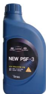
1 л - 03100-00100 – красного цвета

Специальная полусинтетическая жидкость для гидроусилителей руля автомобилей Hyundai, KIA концерна Hyundai Motor Company (HMC).