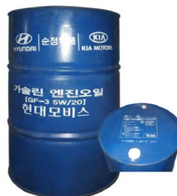
Оригинальный номер 200 л – 05100-00C21