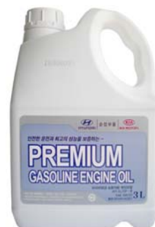
Оригинальный номер 3 л - 05100-00321