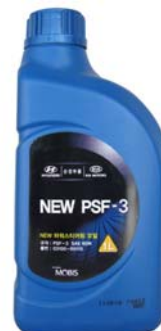
1 л - 03100-00110 – светло-коричневого цвета