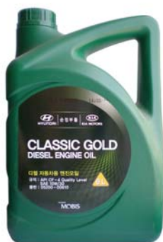
6 л - 05200-00610