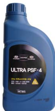
1 л - 03100-00130

Специальная синтетическая жидкость зелёного цвета для гидроусилителя руля автомобилей Hyundai, KIA концерна Hyundai Motor Company (HMC).