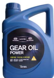
4 л - 02200-00420

Изготовлено на основе высокоочищенного минерального базового масла с добавлением комплекса специальных EP (Extreme Pressure) присадок. Надёжно защищает коробку передач и узлы трансмиссии легковых и грузовых автомобилей, внедорожной и специальной техники при экстремально тяжёлых условиях эксплуатации, включая эксплуатацию автотранспорта в условиях открытых карьеров. Обеспечивает долговременную защиту агрегатов строительной и грузовой техники в условиях высоких переменных нагрузок. Предназначено для современных коробок