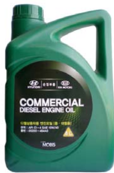
4 л - 05200-484A0

Высококачественное полусинтетическое масло для дизельных моторов легковых и грузовых автомобилей, в том числе оснащенных турбонаддувом, интеркулером или непосредственным впрыском. Производится на основе базового масла, полученного по технологии гидрокрекинга — использование данной технологии позволяет обеспечить высочайший уровень эксплуатационных и защитных свойств и соответствует самым высоким требованиям современных высоконагруженных дизельных двигателей. Гидрокрекинговое базовое масло сочетается с передовой системой присадок, что позволяет достичь высокого уровня защиты всех частей двигателя. Данное моторное масло обладает очень высокими эксплуатационными свойствами, специально создано для обеспечения исключительной защиты современных высокофорсированных дизельных двигателей. Подходит для использования в высокомощных двигателях, работающих в тяжелонагруженных дорожных и внедорожных машинах.