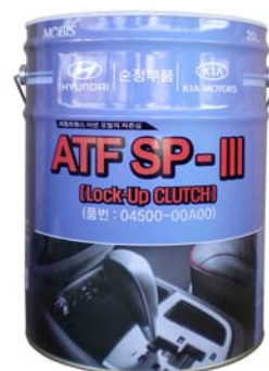
20 л - 04500-00A00