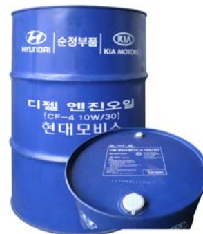
200 л - 05200-00C10