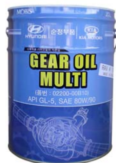
20 л - 02200-00B10

Всесезонное трансмиссионное масло для использования в широком ряде механизмов с прямозубыми, косозубыми и коническими шестернями, совместимо со всеми материалами уплотнений и эластомерными материалами, а также с металлами и сплавами, используемыми в трансмиссиях автомобилей Hyundai и Kia. Создано из минеральных масел высшей очистки, с использованием самых современных противоизносных, антифрикционных, антиокислительных, антипенных и других присадок. Специально подобранные компоненты обеспечивают легкое переключение передач трансмиссии и одновременно гарантируют высокую защиту от износа для шестерен и подшипников. Не образует пену и эмульсии, обеспечивает постоянную смазку и максимальный отвод тепла. Превосходные пластические свойства обеспечивают смазывание при больших удельных давлениях. Превосходная защита от износа, гарантирующая длительную живучесть частей (зубчатые колёса, подшипники, валы, переключатели, и т. п.). Особые вязкостно-температурные свойства этого масла позволяют использовать его всесезонно в широком интервале температур и обеспечивают текучесть при низких температурах. Высокий показатель вязкости гарантирует плавную работу элементов трансмиссии при любых температурах эксплуатации.