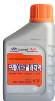
0,5 л - 01100-00A00

Тормозная жидкость уровня качества DOT-3 для тормозных систем автомобилей Hyundai, KIA концерна Hyundai Motor Company (HMC).