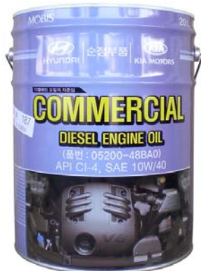
20 л - 05200-48BA0