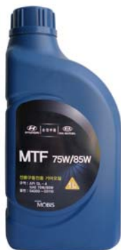
1 л - 04300-00110

Всесезонное полусинтетическое трансмиссионное масло, совместимо со всеми материалами уплотнений и эластомерными материалами, а также с металлами и сплавами, используемыми в трансмиссиях автомобилей Hyundai и Kia. Тщательно подобранный высокоэффективный пакет присадок и синтетическая технология производства базовых масел позволяют сохранять исключительную текучесть при низких температурах и прекрасные синхронизирующие свойства в различных эксплуатационных условиях, одновременно обеспечивая лёгкое переключение передач. Продукт обладает великолепными вязкостными и противоизносными характеристиками, благодаря новейшей технологии присадок обеспечивает сверхвысокую защиту от износа в широком диапазоне температур. Обеспечивает очень легкое переключение передач, обладает высокими синхронизирующими свойствами одновременно с надежной защитой от износа гипоидных и цилиндрических передач. Обладает превосходными низкотемпературными свойствами, гарантирует смазывание всех пар трения даже при очень низких температурах. Высокие антиокислительные свойства гарантируют чистоту деталей трансмиссии.