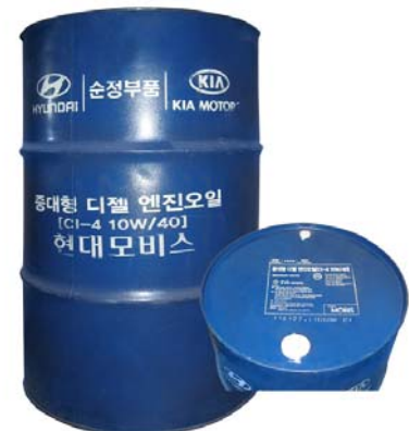
200 л - 05200-48CA0