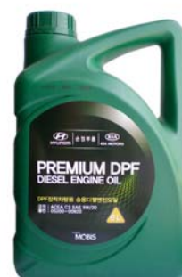
6 л – 05200-00620