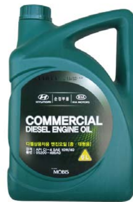
6 л – 05200-486A0