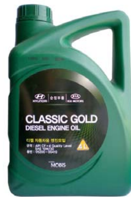
4 л - 05200-00410