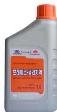
1 л - 01100-00100