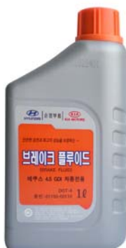
1 л - 01100-00110

Тормозная жидкость уровня качества DOT-4 для тормозных систем автомобилей Hyundai, KIA концерна Hyundai Motor Company (HMC).