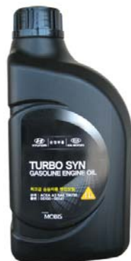
1 л - 05100-00141